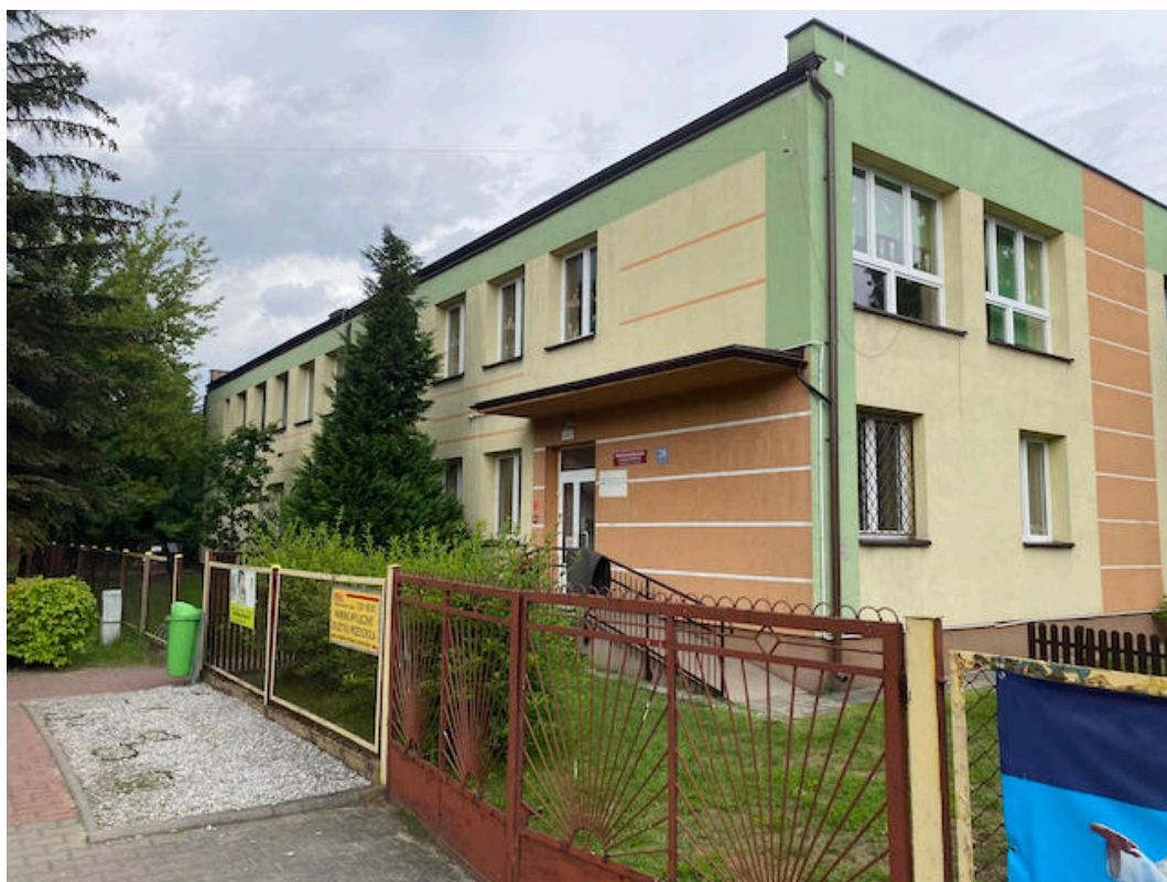
Fotografia z dnia kontroli 12.06.2024 rok